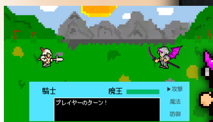
タイトル:魔王の遺志 ジャンル:RPG