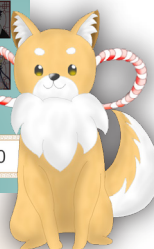
タイトル:咄咄怪事 ジャンル:ノベル+パズル